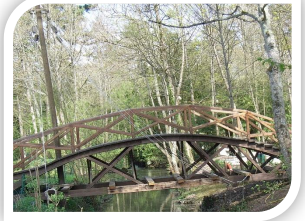
Le Jardin du Clos Lucé et le pont tournant (projet de Léonard de Vinci)