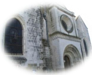
Eglise romane de St Martin le Beau