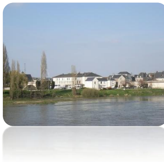
Le gîte Charles Péguy (où nous avons résidé) sur l'Île d'Or à Amboise