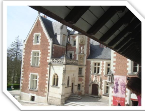
Le Clos Lucé à Amboise