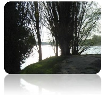
La pointe de l'Île d'Or