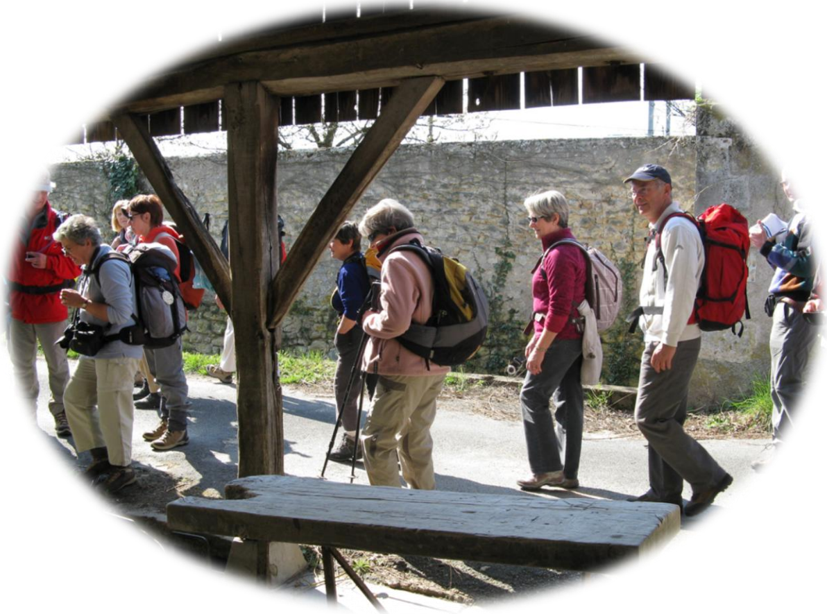
Une partie du groupe des 54 personnes participantes