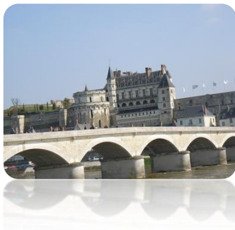
Le Château D'Amboise et le pont sur la Loire