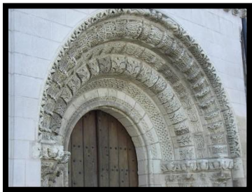
Détail du portail de St Martin le Beau